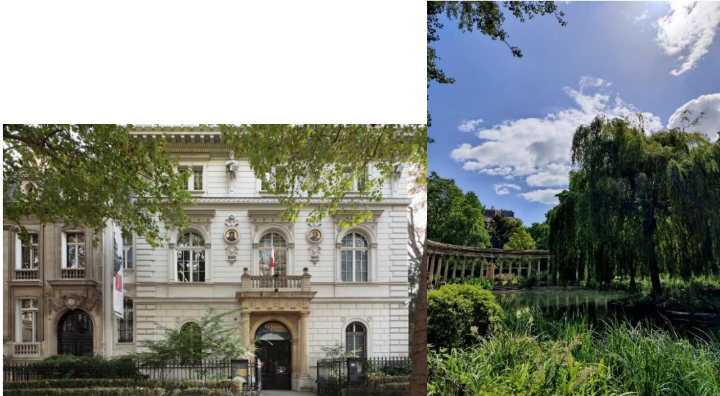
Le Musée Cernuschi Le parc Monceau