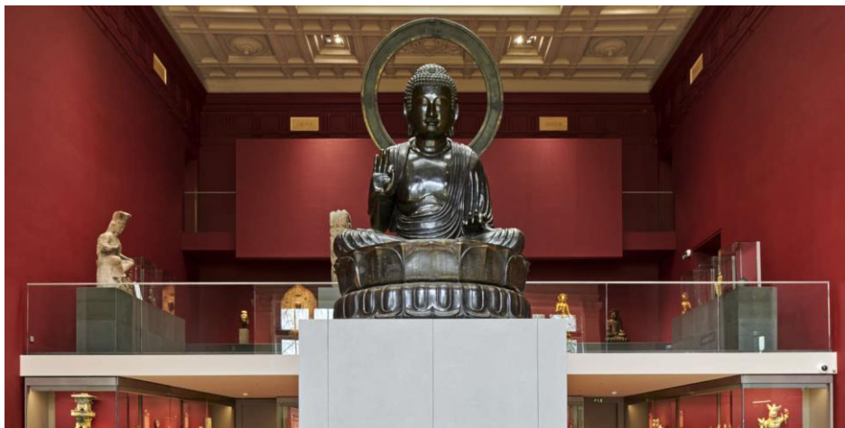
Statue de Bouddha

La visite du parc terminée, nous avons pu entrer dans le musée pour pouvoir contempler la grande statue de bouddha, haute de 4 mètres 40.