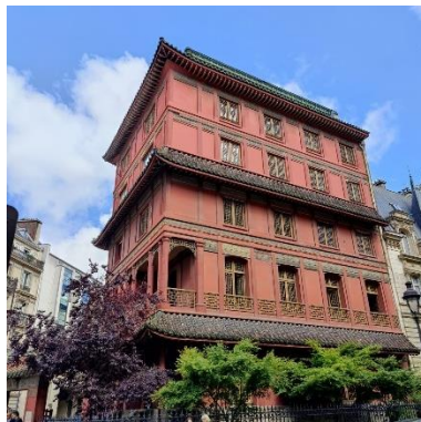
Pagode de Monsieur Loo

La ballade se rapprochant de la fin, la guide décide de nous emmener en dehors du parc Monceau pour nous présenter la seule pagode de Paris, « la pagode de Monsieur Loo », qui est alors en visite durant cette période. Cette pagode d'une grande beauté et de couleur rouge, fait forte impression vis-à-vis des bâtiments haussmanniens.